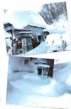
↑ 自然が作り出す雪の造形美。白装の庭が美術館の様。(笑)

ついに大雪がやってきました。毎日朝と夜雪掘りを行い、朝にたまりかたにたまりかた、冬は運動不足になりがちです。良い運動と思えながら作業します。