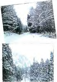
↑ 布方面へスノー散歩。(笑)

とほども雪がやむと美しい秋山郷の風景がながります。先日も観光用の早交を撮影する為一人ご誂もなない布方面の歩道まると一人の雪道散歩は最高。