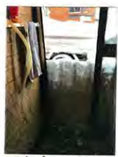
↑ 玄南 かけろと吹雪。ほぼ60cm!! ↓ 村道に出るまで大変!!

ついに大雪がやってきました。毎日朝と夜雪掘りを行い、朝にたまりかたにたまりかた、冬は運動不足になりがちです。良い運動と思えながら作業します。