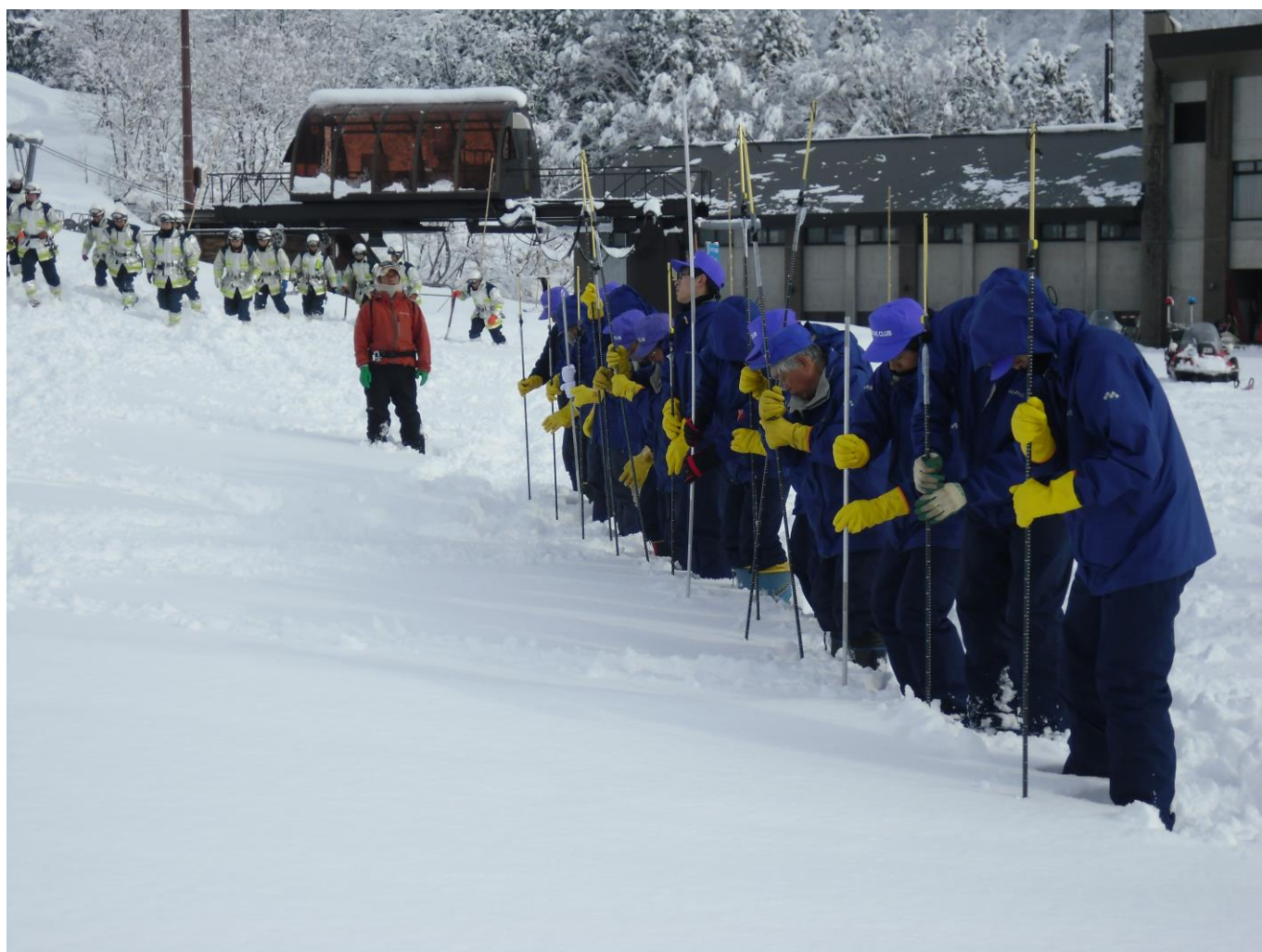
栄村スキー場 第1～第3ペアリフト